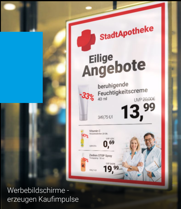
Werbebildschirme - erzeugen Kaufimpulse