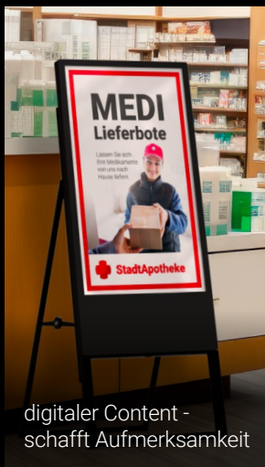
digitaler Content - schafft Aufmerksamkeit